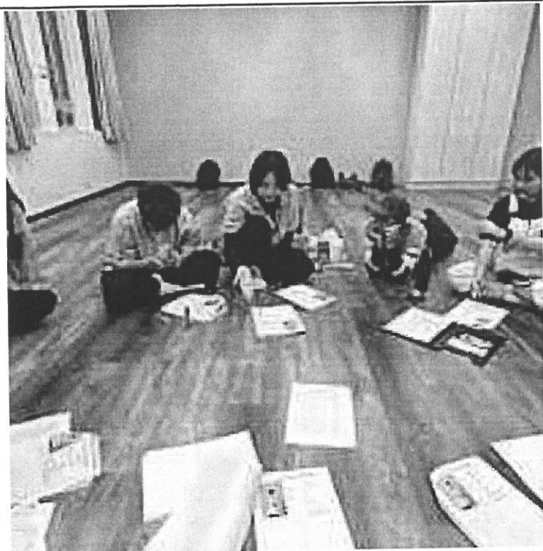
圖片說明：開會討論劇本內容，審核內容，提出意見